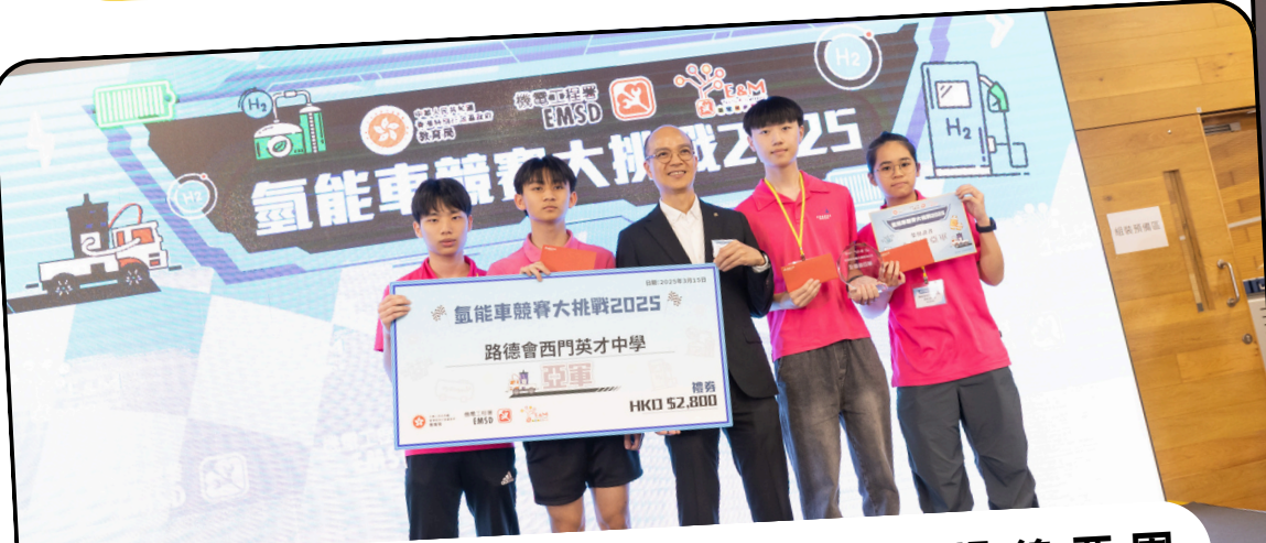
氫能車競賽大挑戰賽區冠軍及全場總亞軍