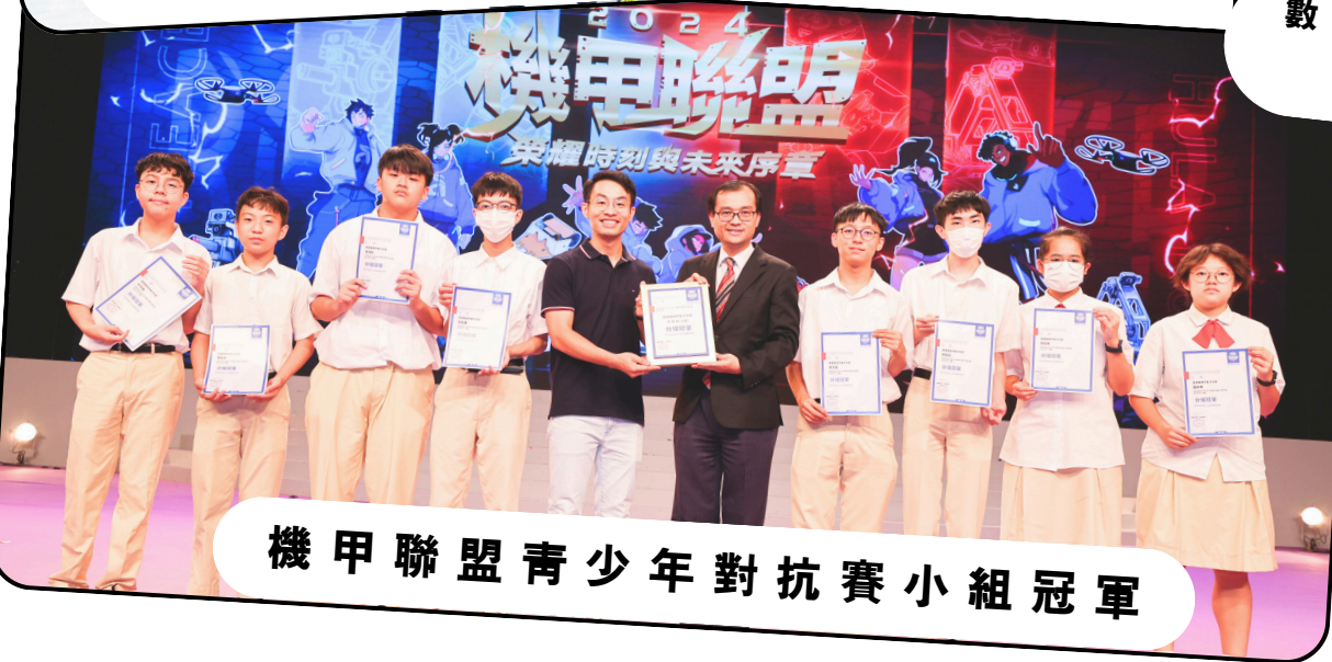
機甲聯盟青少年對抗賽小組冠軍