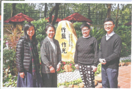
■路德會西門英才中學師生分享交流心得